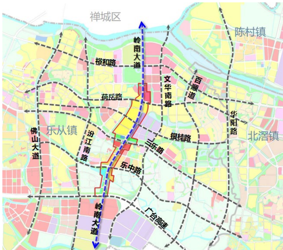
项目规划位置示意图